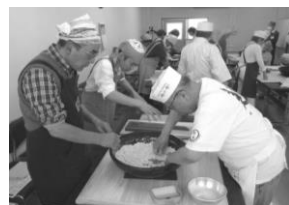
コミセン中庭で「もちつき」料理教室「そば打ち体験」