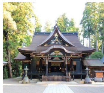
香 取 神 宮

日 時： 9月27日(水) 午前7時30分出発・午後6時30分帰着予定 募集人数： 40名 申込受付： 9月1日(金) 午前10時より 参加費を添えて窓口へ 参加費： 7,000円 行 程： 三鷹駅～幕張PA(休憩)～香取神宮(参拝)～銚子漁港 「うおっせ21」昼食&お買い物～銚子ポートタワー～ヤマサ 醤油工場見学～幕張PA(休憩)～三鷹駅