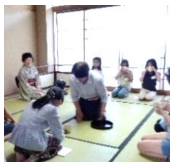
中央コミセン 茶室

日常生活で体験できない時間は、子供たちの成長のなかで大きな力となって行くことでしょう。講師は元小学校教諭です。作法の中から道徳教育も含めた指導を行ないます。