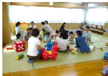
中町集会所 大広間

中町集会所で昨年10月から月2回の「collabono コミセン親子ひろば」を「すくすく泉」のスタッフが担当しています。常設ひろばはいつでも行ける良さがありますが、この日を目指して集まるのも嬉しいもので、いつも賑やかな集いになっています。おんぶの講座、読み聞かせなどのプログラムも加えて楽しんでいます。毎回、初めての方が来て、地域に子育ての輪が広がっています。お手伝いに来て下さる方大歓迎です。