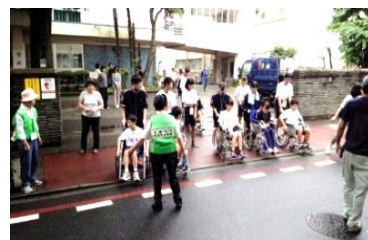
車椅子で移送訓練